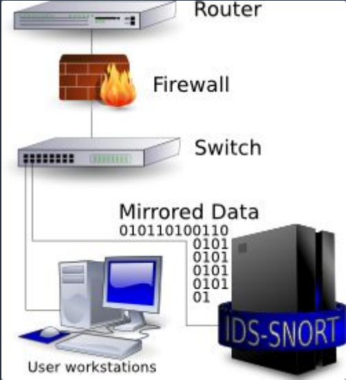
Схема расположения сетевой СОВ