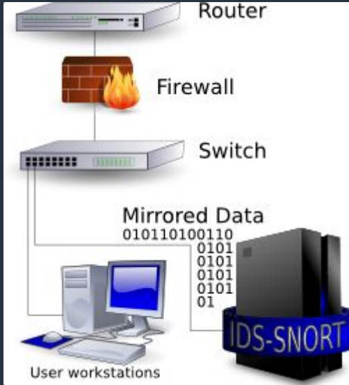
Схема расположения сетевой СОВ